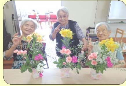
9/15ミニフラワーアレンジメント