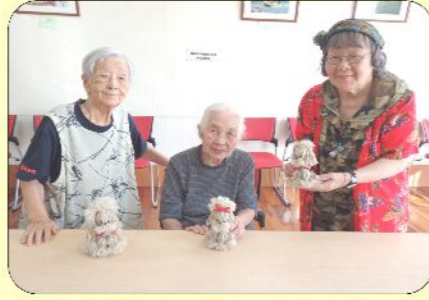
8/23毛糸の犬の置き物作り