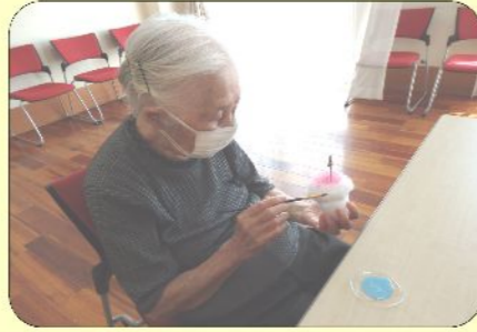
7/26かき氷スタンド作り