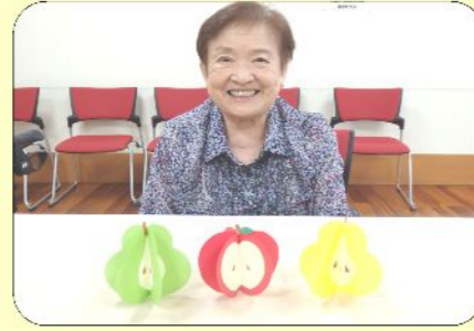
9/17りんごど洋なしの飾り作り